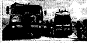
Tremila soldati per pattugliare le città