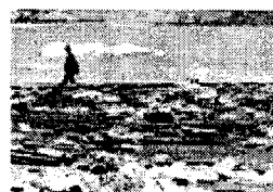
Rifiuti a Napoli

Il ministro ha avanzato alcune proposte per andare oltre l'emergenza. «Ho indicato il modello Calabria sulla raccolta differenziata, che ha investito 20 milioni di euro per passare dal 10 al 40% con la quantità di differenziata prodotta. Ho chiesto alla commissione Jucci di studiare il biogasificatore, stiamo facendo esaminare altri impianti in Europa, vogliamo impianti che non scaricano nell'atmosfera nulla», ha concluso Alfonso Pecoraro Scario.